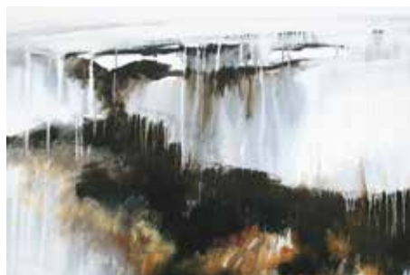
TRANSPARANTIE EN EXPRESSIE DRUIPTECHNIEKEN