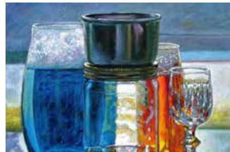
GLANS ZONDER WEERGA ACRYL

Had je altijd al eens een koe willen schilderen? De koe is verbonden met Friesland/Nederland. Bij het schilderen van een koe leer je eerst naar vorm en sfeer (= licht donker) te kijken. Op verschillende manieren leer je een koe/koeien op te zetten (compositie en kleurstelling) en te schilderen. Je leert een koeienkop te schilderen en de hele koe/koeien.