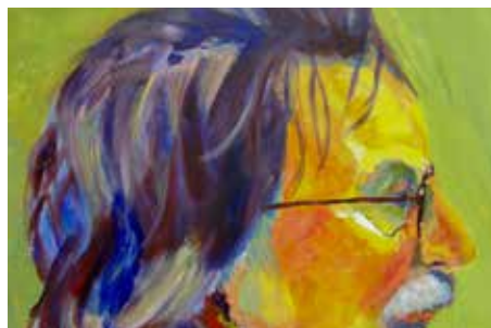
PORTRET HOUTSKOOL EN ACRYLVERF