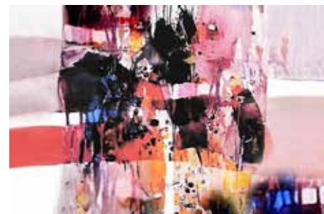
MUSIC IN THE AIR TEKENEN EN SCHILDEREN

Terwijl er een model voor ons poseert leren we hoe een portret op te zetten, huidskleur te mengen en een schilderij verder uit te werken. "De opzet" is een belangrijk onderdeel. Een goed (gelijkend) portret begint bij de vorm van het grote geheel: de vorm van de schedel, de lengte van de nek, de haarkap en de vorm van de schouders. Een goed begin is het halve werk! Er wordt gestart met een "warming up": het maken van enkele houtskool studies om het gezicht van ons model te verkennen. Aandacht hierbij voor (algemene) verhoudingen, de karakteristiek en plastiek. De opzet van het portret in verf volgt daarna waarbij gekozen kan worden voor een beperkt- of een volledig palet. We streven naar een vlotte opzet en het realistisch weergeven van een gezicht, maar er is ook ruimte om hiervan af te wijken en expressiever te werk te gaan.