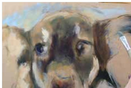
HUIDDIEREN IN OLIEVERF HOND, KAT OF ....