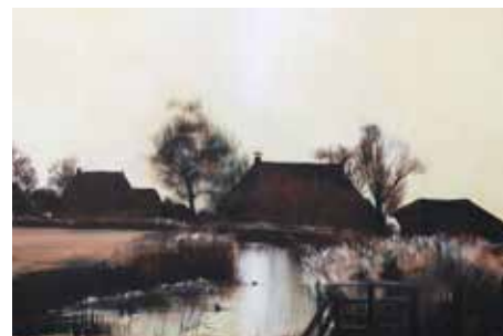
PLONS! SLOTEN, BERMEN EN RIET