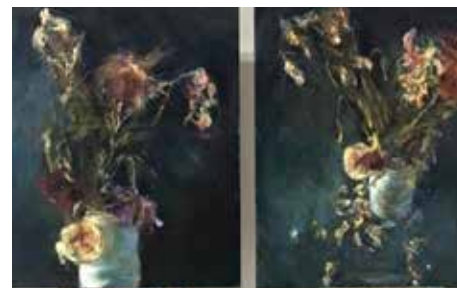
VERGANKELIJKHEID IN BLOEMSTILLEVENS

Transparant werken met zeer dunne acrylverf, geeft een spannende gelaagdheid. Waterige verf kan van je schilderij aflopen. In deze workshop probeer je verschillende waterige technieken uit: werken met plassen verf, granuleren en druipen. Deze techniek is niet het doel op zich, maar kan een middel zijn om expressie toe te kunnen voegen. Een dag lang werken met dunne verf, goed leren kijken en toepassen in verschillende onderwerpen.