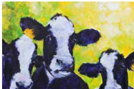
KOEIEN SCHILDEREN HOLLANDS GLORIE